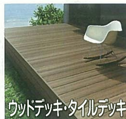
ウッドデッキ・タイルデッキ