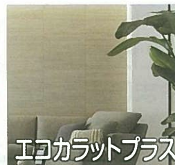
エコカラットプラス